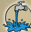
PROVISIONING Fresh Water