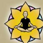
CULTURE Spiritual Experience