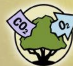
REGULATING Carbon Storage