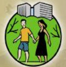
CULTURE Recreation and Health