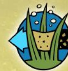
REGULATING Waste-Water Treatment