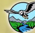
HABITAT Species and Ecosystems