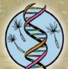
HABITAT Genetic Diversity