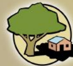
REGULATING Local Climate